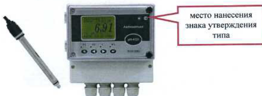
Рисунок 5 - pH-метр промышленный pH-4122, pH-4122.П (настенное исполнение), pH-4131