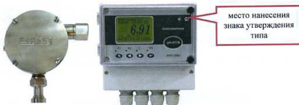
Рисунок 2 - pH-метр промышленный pH-4110