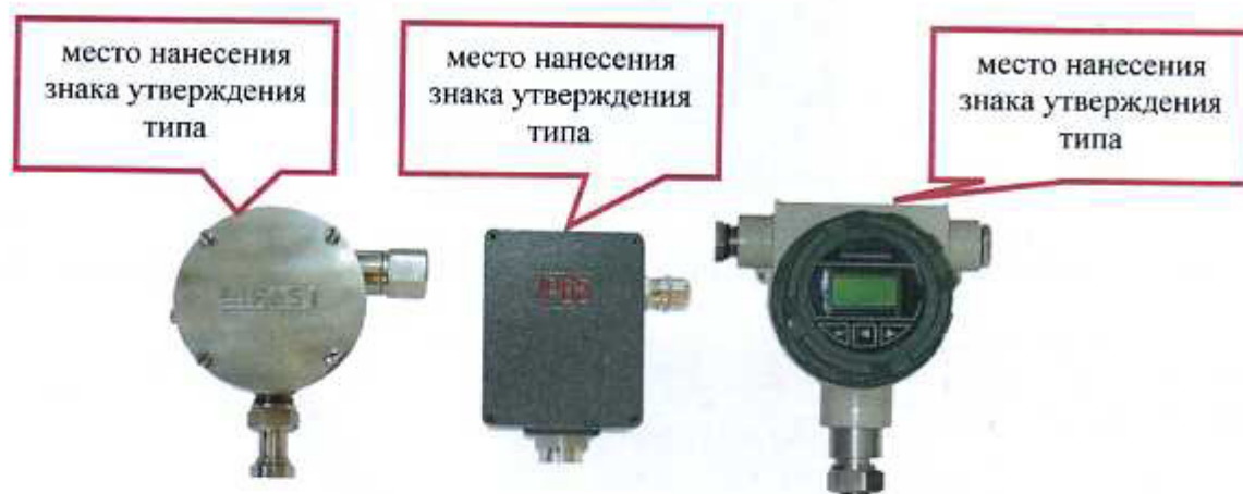
Рисунок 1 - рН-метр промышленный рН-4101 в исполнениях «Н», «Д», «И»

Общий вид рН-метров и обозначение мест для размещения знака утверждения типа представлены на рисунках 1-5.