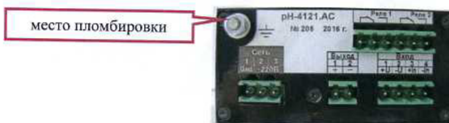
Рисунок 7 - Схема пломбирования рН-4121