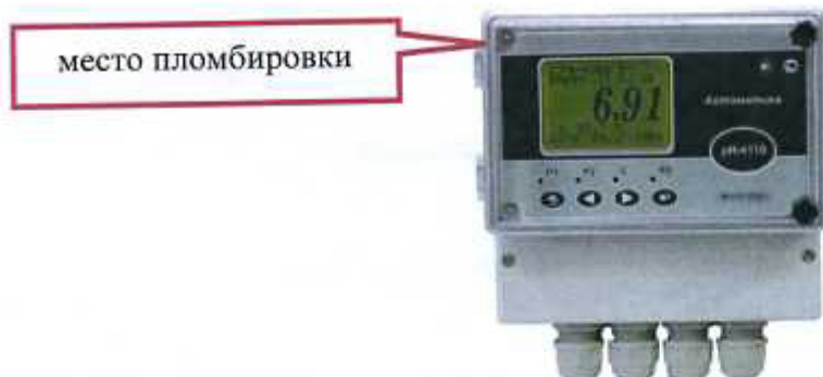
Рисунок 9 - Схема пломбирования рН-4110, рН-4122(настенный вариант), рН-4122.П(настенный вариант), рН-4131

Используемые электроды представлены на рисунках 10 - 14.