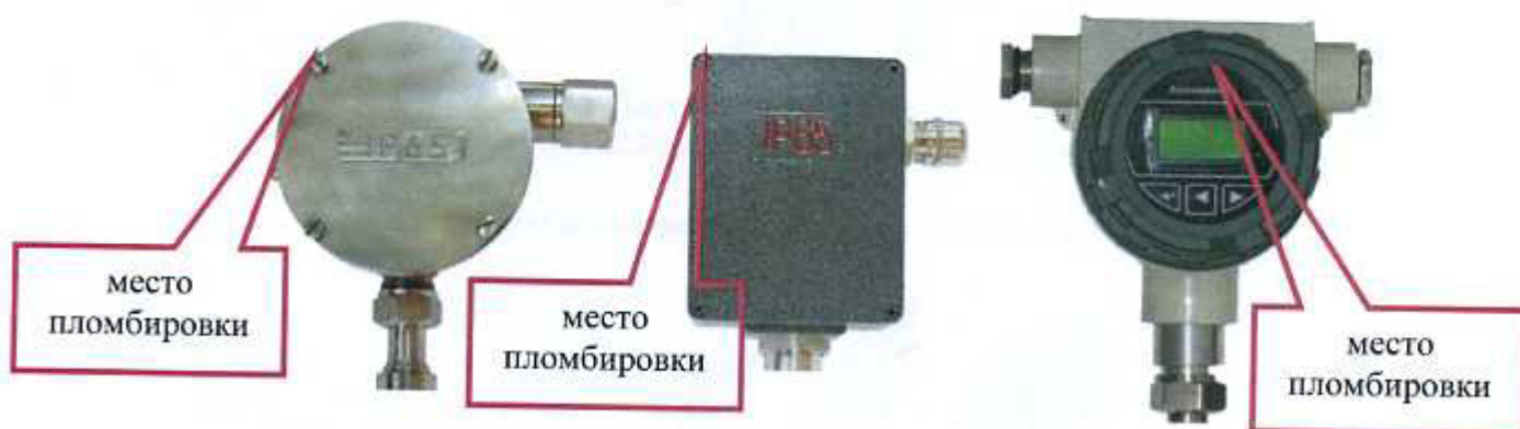
Рисунок 6 - Схема пломбирования рН-4101

Места размещения голографических наклеек для предотвращения несанкционированного доступа представлены на рисунках 6-9.