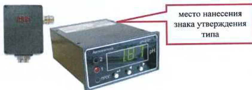
Рисунок 3 - pH-метр промышленный pH-4121