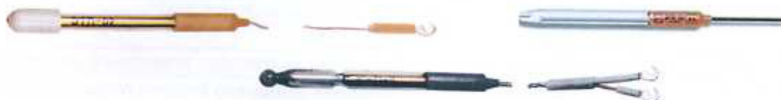
Рисунок 13 - pH-электроды ЭТП-02, ЭРП-101, и ЭС-71 серий