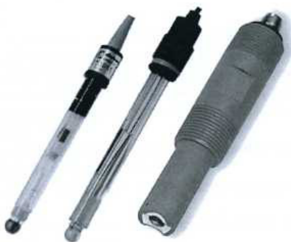
Рисунок 10 - рН-электроды SZ и ID серий

Используемые электроды представлены на рисунках 10 - 14.