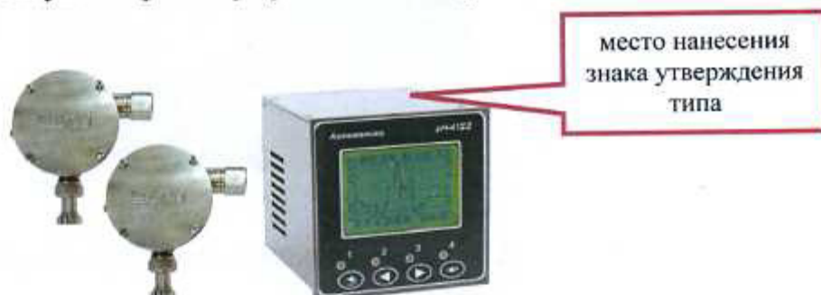
Рисунок 4 - pH-метр промышленный pH-4122, pH-4122.П (щитовое исполнение)